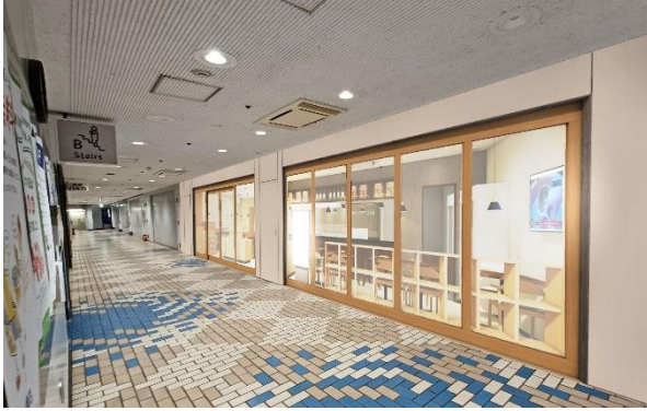
▲「るるぶキッチン」のファサード（イメージ）