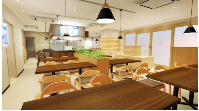
▲「るるぶキッチン」の店内（イメージ）