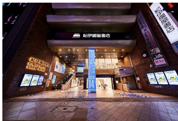
▲紀伊國屋書店 新宿本店

2017年に開業した「るるぶキッチン」は、旅行ガイド「るるぶ」の編集者が全国各地を旅して見つけた“おいしい”をお届けするリアル店舗メディアです。期間限定で開催される「特集フェアメニュー」では人気観光地から知られざる地域まで日本各地にフォーカスし、その土地の産品を活かしたオリジナルメニューをお楽しみいただけます。食材を通じて全国の地域や特産品、生産者を知ること、 “続きは現地で”を合言葉に、お客様の旅のきっかけ作りを提供してまいりました。